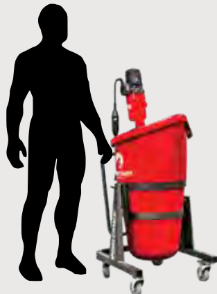
おおよそのサイズ感