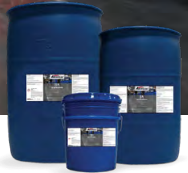
19L / 113L / 208L / 946L

多孔質コンクリート用に開発された 水性強化剤 。 汚れの浸透を防ぎ、ホコリを抑え空気をクリーンに保ちます。