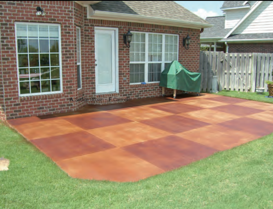
A Saddle Brown · F Carmel