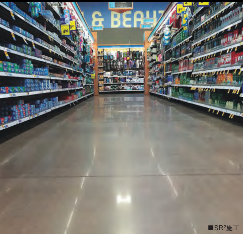
■SR 2 施工

SR 2 を散布し48時間水中に水没させたテストピースの実験結果です。赤線枠内の通り、SR 2 が浸透している約1センチの部分は、水の侵食を防いでいます。