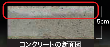
コンクリートの断面図

SR 2 を散布し48時間水中に水没させたテストピースの実験結果です。赤線枠内の通り、SR 2 が浸透している約1センチの部分は、水の侵食を防いでいます。